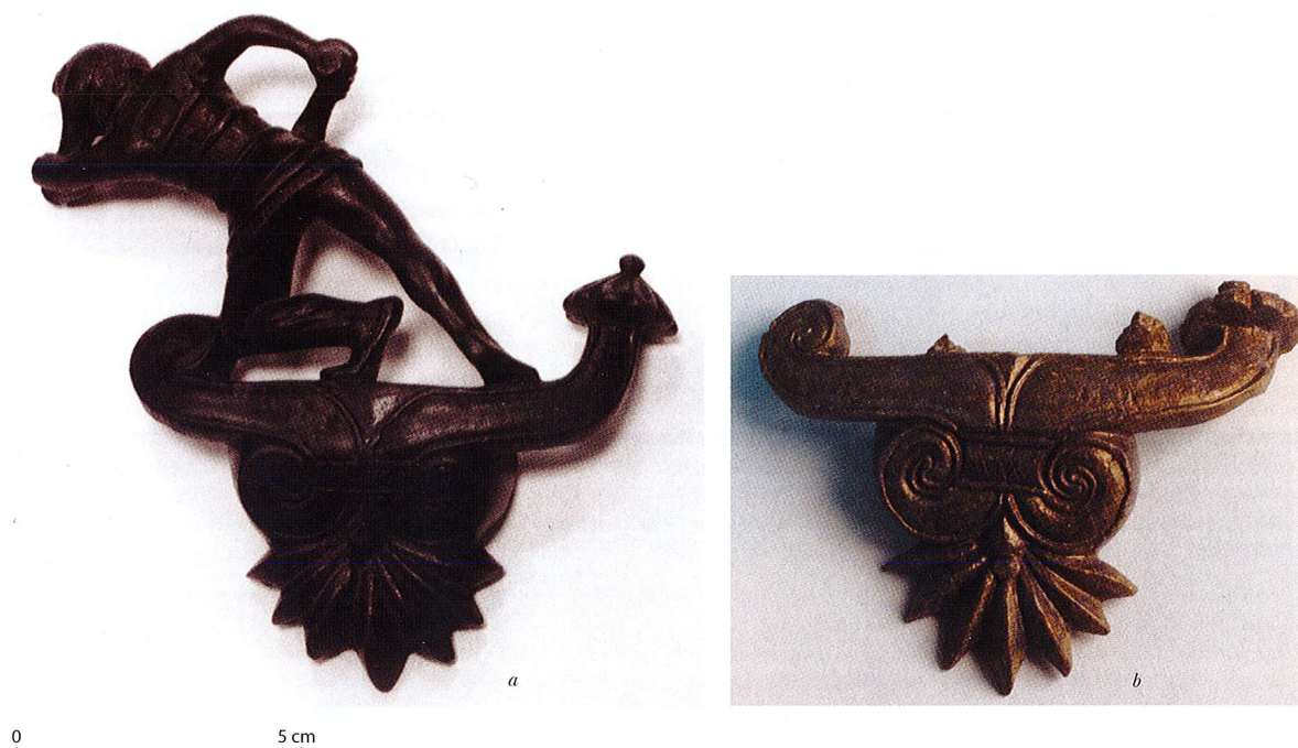
Fig. 3. Les deux exemplaires de fragment d'anse de bassin étrusque, face externe. – a. celui de Saintes-Gemmes-sur-Loire ; – b. celui de Barzan.

exceptionnels. Deux exemplaires de céramique attique y ont en effet été recueillis, dont l'un, assurément associé à ces niveaux anciens, est daté de la fin du ve siècle a.C. 10 . Un fragment d'anse de bassin étrusque complète cet inventaire et achève de conférer à ce site un caractère singulier.