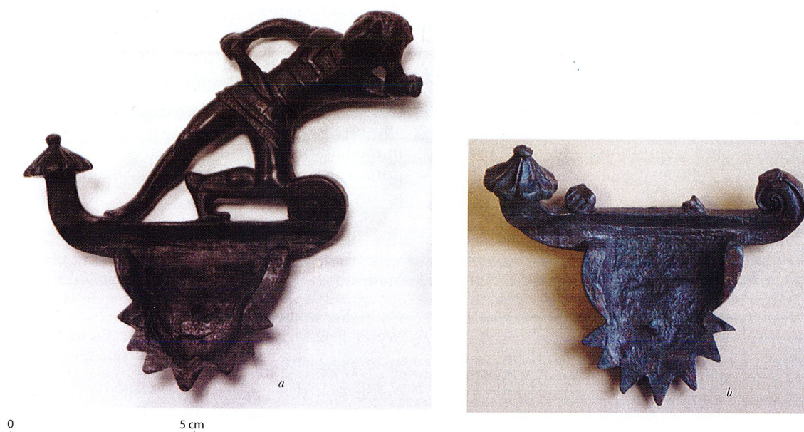
Fig. 4. Les deux exemplaires de fragment d'anse de bassin étrusque, face interne, – a. celui de Saintes-Gemmes-sur-Loire ; – b. celui de Barzan.