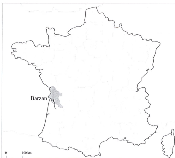
Fig. 1. Localisation du site du Moulin du Fâ (Barzan, Charente-Maritime).

Le Moulin du Fâ, sur la commune de Barzan, se situe actuellement à 2 km de l'estuaire de la Gironde (fig. 1), dans un paysage de versant en pente douce s'ouvrant sur la baie. Le site semble implanté sur une voie côtière antique reliant Saintes à Bordeaux 1 . Connu dès le XVIII e siècle par le géographe Claude Masse, celui-ci n'a cependant fait l'objet d'une reconnaissance archéologique qu'à partir de 1921. Les fouilles se sont poursuivies sur les thermes et le sanctuaire jusqu'en 1957. À partir de 1975, une grande partie de la ville antique est révélée, grâce aux prospections aériennes de Jacques Dassié 2 . Depuis 1996, plusieurs opérations programmées sont en cours 3 . La reprise de la fouille du sanctuaire, en 1998 4 , a permis la découverte de niveaux archéologiques antérieurs à l'époque romaine,