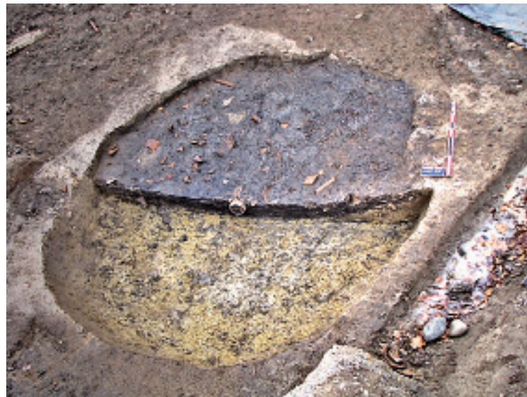
Fig. 2. Vue d'une fosse atelier. On remarquera en coupe, à droite, la présence d'une banquette en terre rapportée.